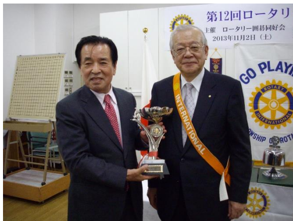
初優勝の中川淳之助五段に名人の優勝杯。